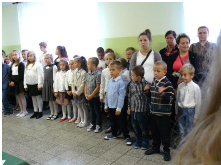
Rozpoczęcie roku szkolnego w Zabrnju.

Początek roku szkolnego zawsze kojarzy się z czasem przepętnionym emocjami. Maluchy po raz pierwszy zmierzają się ze słynnym szkolnym ołówkiem (symbolem pasowania na ucznia), uczniowie wrócą do obowiązku nauki, a maturzyści będą przygotowawali się do opuszczenia szkolnych murów. Każdej z grup będą towarzyszyły uczucia podekscytowania nieznanym, czasem niechęci rozstania się z wakacyjną swobodą, a także strachu przed ostatnim egzaminem dojrzałości. Koniec wakacji jest czasem szczególnie trudnym dla tych z uczniów, którzy niekoniecznie za szkołą tęsknili. Dla tych, dla których szkoła jest bezpieczną przystanią, miejscem, które znają i wiedzą jak w nim przetrwać, jest momentem radości, końcem oczekiwania na usystematyzowany schemat działań. To w niej niektórzy odnajdują znajomych i przepis na