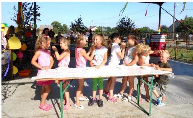
Młodzi artyści na Wakacjadzie w Zabrnju

Niedzielną popołudnie 25 czerwca było okazją do spędzenia czasu w bardzo ciepłej i radosnej atmosferze na „Wakacjadzie” w Zabrnju. Wystąpiły zespoły ludowe: Jagoda z Zabrnja i Jarzębina z Krawców, które zaprezentowały swoje wokalne umiejętności. Zgromadzona publiczność mogła także podziwiać liczne pokazy taneczne oraz scenki przygotowane przez najmłodszych. Podczas spotkania nie zabrakło konkursów i atrakcji dla dzieci.