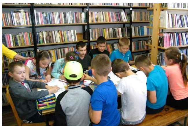
Uczniowie w nowej bibliotece