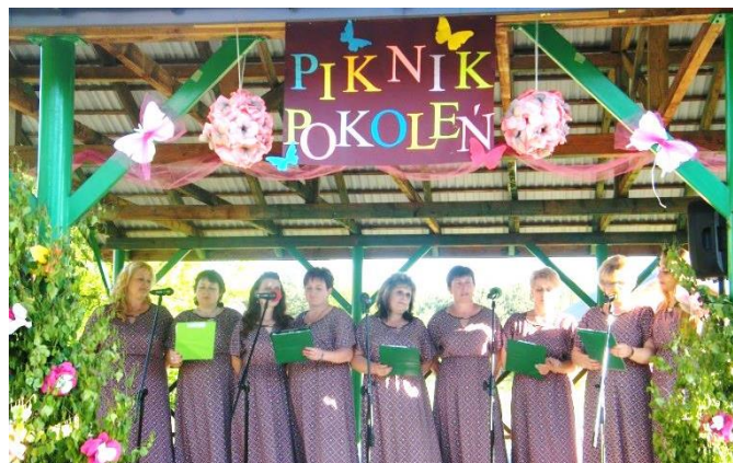
Zespół „Jagoda z Zabrnia”