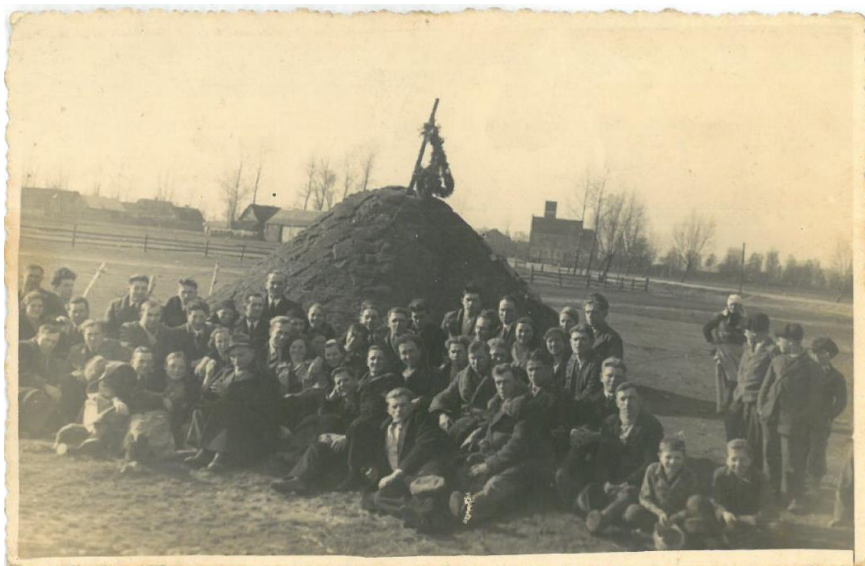
Fotografia z marca 1938r

Za udział w strajku i wiecu działacze zostali skazani na kary więzienia od 10-ciu miesięcy do nawet 4 lat.