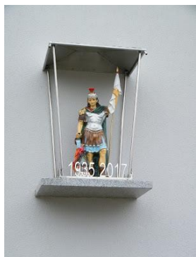
Figurka Św. Floriana