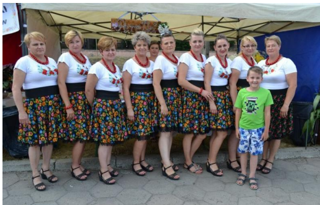
Zespół „Stalowianki” ze Stalów

10 września w niedzielę Zespoły: Jarzebina z Krawców, „Perełki” z Żupawy i „Stalowianki” ze Stalów prezentowały się na Imprezach z okazji Dnia Działkowca oraz na Pikniku Florieńskim Ojców Dominikanów w Tarnobrzegu. Obie imprezy zgromadziły rzesze wielbicieli folkloru i muzyki ludowej. Występy naszych zespołów zostały przyjęte ogromnymi brawami, a przygotowane stoiska były oblegane przez smakoszy tradycyjnych potraw. Gratulujemy występów.