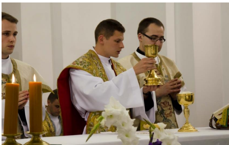
Pierwsza Msza Święta