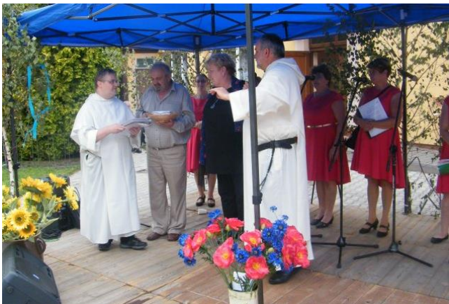
Powitanie Ojca Przeora przed występem „Jarzebiny”