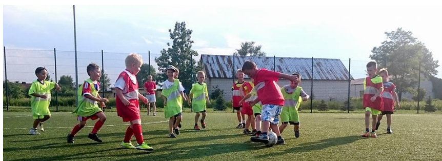
Sportowa przyszłość Gminy Grębów

rozgrywek w lidze. Mamy nadzieje, że przyciągnie to większą liczbę chętnych w różnym wieku, gdyż stawiamy na rozwój dzieci, młodzieży, a także rozwój naszej Szkółki. Chcemy, aby nasi podopieczni stanowili sportową przyszłość naszej Gminy Grębów, a może i więcej. Struktura naszej Szkółki dzieli uczestników na 3 grupy. Wszyscy z nich chętnie i z wielkim zaangażowaniem uczestniczą w zajęciach, które odbywają się dwa lub trzy razy tygodniowo. Oprócz kształtowania umiejętności piłkarskich stawiamy na dobre wychowanie i dyscyplinę, która jest niezbędna w prowadzeniu zajęć. Regularne treningi, udział w turniejach i rozgrywkach sprawiły, że jesteśmy znani i szanowani w naszym najmłodszym środowisku piłkarski. Warto wspomnieć o tym, że nie tylko chłopcy są zainteresowani Piłką Nożną, wraz z nami trenują też dziewczynki. Chętnie przyczynimy się do spełnienia marzeń niejednego młodego piłkarza, dlatego zachęcamy rodziców do