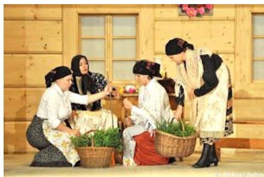
Kalina z „Adwentowym wieczorem w Walkowej chacie”

W dniach 22-23 kwietnia 2017 roku, na scenie Miejsko-Gminnego Ośrodka Kultury w Sędziszowie Małopolskim odbył się XXIX Wojewódzki Konkurs „Ludowe obrzędy i zwyczaje”, zaprezentowało się w nim 17 zespołów obrzędowo-teatralnych z woj.podkarpackiego. Naszą gminę reprezentowały dwa zespoły: Jamniczanki oraz Kalina z Zapolednika Jamniczanki zaprezentowały widowisko pt.: „Adwentowy wieczór w Walkowej chacie”. To bardzo dynamiczne przedstawienie.