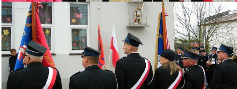
Ślubowanie drużyny młodzieżowej OSP