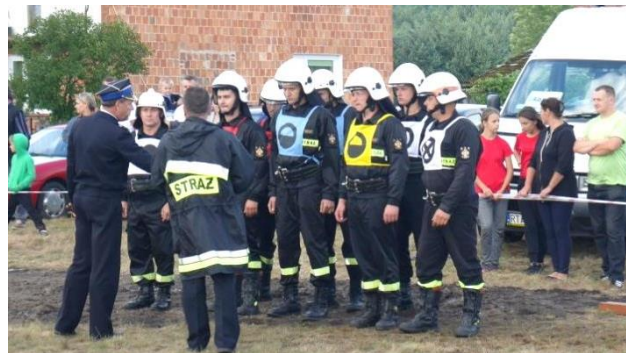
Zawody Gminne w Zabrzu