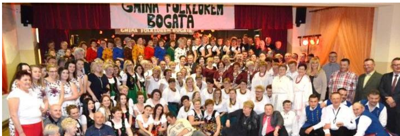
Nasze zespoły: śpiewacy, kapela ludowa i miłośnicy folkloru.

W piątek 21 kwietnia odbyło się spotkanie zespołów folklorystycznych. Gmina Grębów jest wyjątkowa pod względem ilości zespołów ludowych, w których działa ponad 200 osób. Nie ma takiej drugiej gminy na Podkarpaciu, a w skali kraju należy do czołówki. Wydarzenie to miało charakter integracyjny, na którym zespoły zaprezentowały swój dorobek artystyczny. Ponadto spotkanie miało na celu promocję folkloru i dziedzictwa folklorowego regionu oraz promocję lokalnych produktów. W niezwykle bogatym i barwnym programie imprezy nie zabrakło degustacji potraw regionalnych, licznych zabaw oraz występów wokalnych 14 zespołów ludowych. Na scenie zaprezentowały się zespoły: Jamniczanki, Grębowianki, Słowianie z Grębowa, Stalowianki, Wydrzowianie, Kalina z Zapolednika, Bajka z Wydrzy, Jagoda z Zabrnia, Jarzębina z Krawców, KGW Koniczyna z Siedliska, Perełki z Żupawy, orkiestra dęta oraz kapela ludowa. Wśród gości byli także uczestnicy Akademii Seniora.