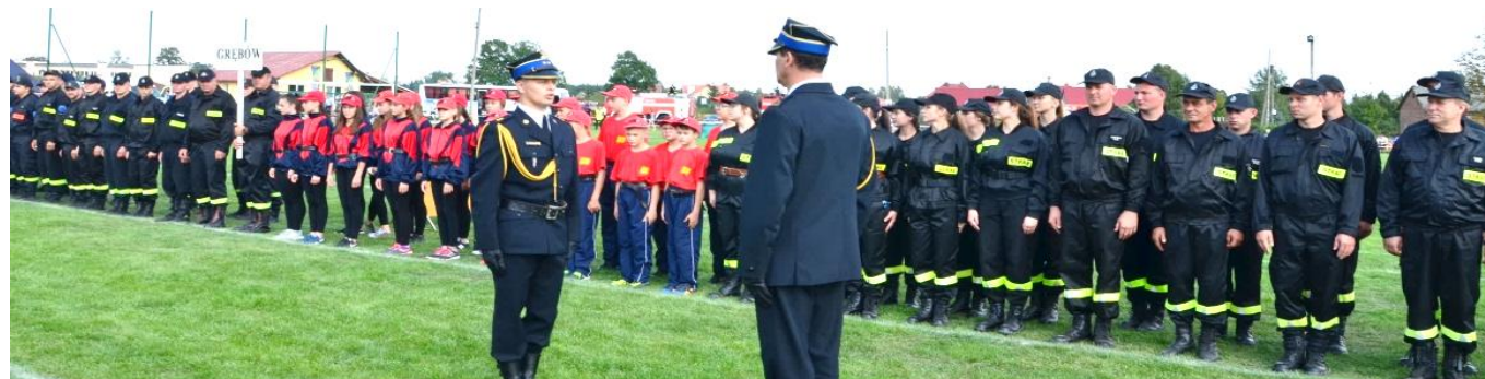
Zawody Powiatowe w Jadachach

10 września 2017 roku w Jadachach odbyły się X Powiatowe Zawody Sportowo-Pożarnicze OSP i MDP z terenu powiatu tarnobrzskiego. W zawodach drużyna MDP dziewcząt z Żupawy zajęła doskonale I miejsce i będzie reprezentowała gminę i powiat na zawodach wojewódzkich, natomiast w grupie "A" drużyna OSP Krawce zajęła wysokie II miejsce.