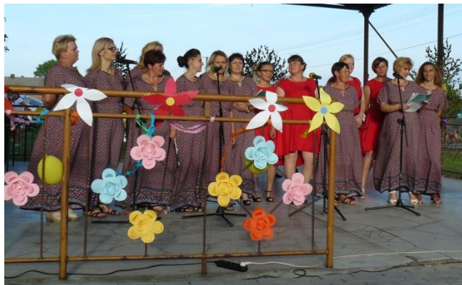
Zespół „Jarzębina” z Krawców i „Jagoda” z Zabrnja