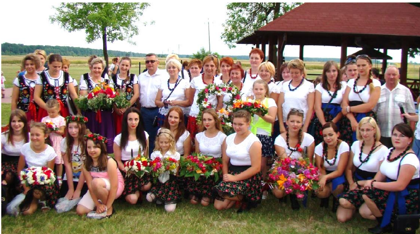
Wiła wianki i rzucała je do wody...

Noc Świętojańska w Orliskach Żupawskich , mieszkańcy Orlisk Żupawskich oraz okolicznych miejscowości niedzielne popołudnie 25 czerwca spędzili na imprezie plenerowej pod hasłem „Noc Świętojańska”. Program artystyczny obfitował w występy zespołów ludowych, liczne konkursy i atrakcje dla najmłodszych. Na scenie zaprezentowały się zespoły: Perełki z Żupawy, Stalowinaki i Koniczyna z Siedliska. Głównym punktem programu był konkurs na „Najpiękniejszy Wieniec Świętojański”. Wieńce wykonane z żywych kwiatów i ziół zgodnie z tradycją zostały rzucone na wodę.