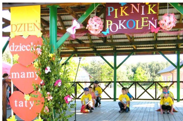
Młodzi artyści na Pikniku Pokoleń w Krawcach

Licznie zgromadzona publiczność gromkimi brawami przyjęła występy uczniów ze Szkoły Podstawowej w Krawcach, piękny taniec najmłodszych, wiersze i skecze wszystkim się podobały. W dalszej części wysłuchaliśmy koncertu Zespół „Jagoda” z Zabrnia. Swój występ zaprezentował także zespół „Jarzębina”. Odbyły się również ciekawe konkursy i zabawy o tematyce ekologicznej, przygotowane i prowadzone przez Stowarzyszenie „Zielona Stalówka” ze Stalowej Woli. Dzieci uczestniczyły w konkursach z zakresu segregacji odpadów komunalnych, recyklingu i ochrony środowiska. Najlepsi uczestnicy konkursu otrzymali nagrody a pozostali upominki. Była też degustacja ciast i tradycyjnych potraw