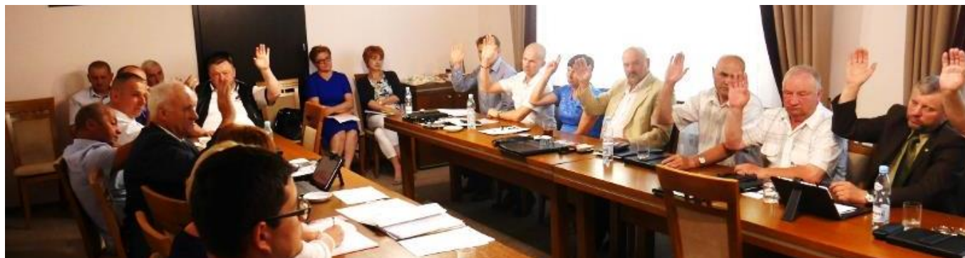
Głosowanie Radnych nad absolutorium

Dobudowa linii oświetlenia ulicznego na terenie gminy – 144 616,23 zł, Przebudowa drogi gminnej Krawce Nr 100234R – 162 089,80 zł, Utwardzenie placu w centrum Grębowa – 148 500,00 zł, Przebudowa dróg gminnych – 823 212,28 zł, Przebudowa dachu na Szkole Podstawowej w Krawcach – 188 099,44 zł, Budowa placu zabaw dla Przedszkola w Stalach – 87 096,30 zł, Budowa nawodnienia boiska sportowego w Grębowie – 47 551,80 zł, Budowa siłowni zewnętrznej w Grębowie – 71 528,60 zł, Remont elewacji budynku remizy OSP Krawce – 55 251,11 zł, Remont pomieszczeń w budynku świetlicy w Stalach – 41 762,07 zł, Rewitalizacja kopca z okresu strajku chłopskiego – 15 000,00 zł, Prace melioracyjne na terenie gminy – 79 168,22 zł