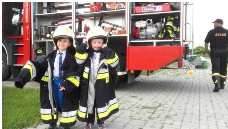
Młodzi strażacy - narybek OSP

najmłodszych liczne niespodzianki. Dzieci zapoznali się z wyposażeniem straży pożarnej, ekwipunkiem osobistym strażaka, narzędziami hydraulicznymi, a także osprzętem i armaturą wodną wozu strażackiego. Nie zabrakło występów dzieci i młodzieży szlifujących swoje talenty pod okiem instruktorów w GCK. Na scenie zaprezentował się również zespół taneczny „Flash” z Baranowa Sandomierskiego. Imprezie towarzyszyły: stoiska gastronomiczne, grill oraz wesołe miasteczko.