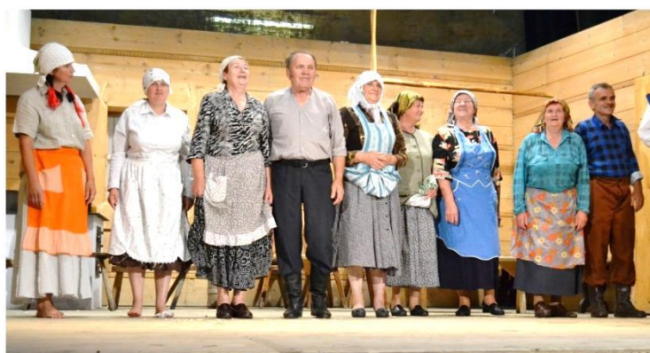
Jamniczanki na scenie Teatru Wielkiego

Wykonawcy w humorystycznym, wartkim scenariuszu ukazali na scenie dużo bardzo istotnych dla kultury lasowickiej zwyczajów, obyczajów codziennego, domowego życia w okresie adwentu. Łuskanie grochu jest pretekstem do przekazania córkom ważnych wiadomości, które z tradycyjnymi wierzeniami mają im pomóc w przyszłym, dorosłym życiu. Pojawiają się wróżby adwentowe dla dziewcząt typu: „Rorocie, Rorocie jakie imię mocie?”, czy : „Poszukosz w adwencie , będziesz mieć przy święcie”. Walorem teatralnym tego przedstawienia jest wzajemne słuchanie się, dobrze skomponowane dialogi i trafna obsada aktorska, dobra dykcja. Kalina z Zapolednika przedstawiła widowni pracę i działania związane z konstrukcją płamy wielkanocnej. Oczywiście wszystkie czynności osadzone w regionalnej kulturze lasowiackiej. Dowiadujemy się z widowiska z jakich składników wykonuje się tradycyjną palmę wielkanocną oraz o jej magicznym znaczeniu dotyczącym mocy wegetacyjno-agrarnych. Zespół otrzymał słowa uznania za kultywowanie gwary regionalnej i dobrą grę aktorską! Zespół Jamniczanki zdobył w Sędziszowie pierwszą nagrodę ufundowaną przez Dyrektora Wojewódzkiego Domu Kultury w Rzeszowie. Kalina otrzymała wyróżnienie. Oba zespoły nominowane zostały na sejmik w Bukowinie Tatrzańskiej. Tam jury na konkurs ogólnopolski nominowało zespół Jamniczanki. Odbędzie się on w Tarnogrodzie już jesienią. Serdecznie gratulujemy obu zespołom nowych doświadczeń scenicznych i licznych sukcesów!