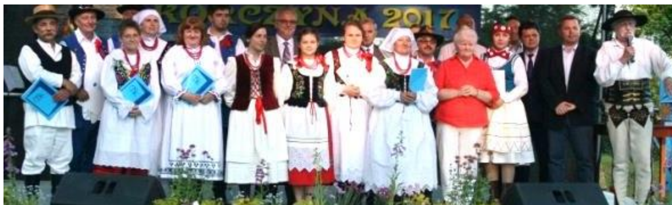
Grębowianki na Przeglądzie Pieśni i Muzyki Ludowej

II miejsce na XXVI Przeglądzie Kapel, Śpiewaków i Instrumentalistów Ludowych „Pogórzańska Nuta” (21.05.2017)