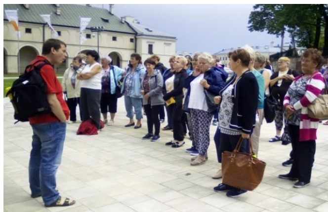
Panie z Akademii Seniora wyruszają na wycieczkę