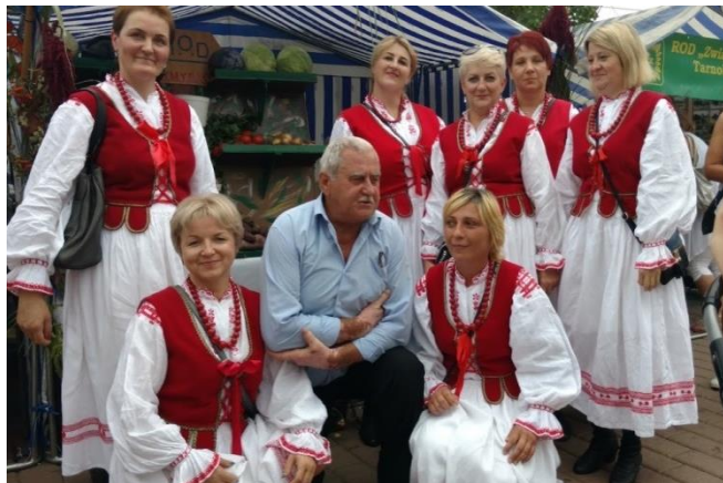
Zespół „Perełki” z Żupawy