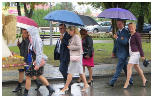
Dożynkowy orszak w deszczu

plonów nikt tu nie pamięta, grupy wieńcowe szły pod parasolami, a wieńce były chronione folią. Deszcz nie