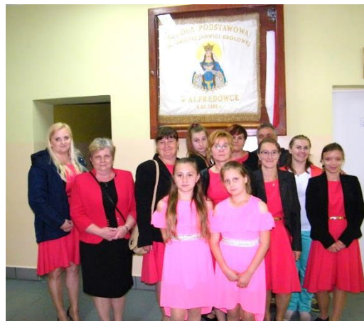
Jarzębina w Alfredówce