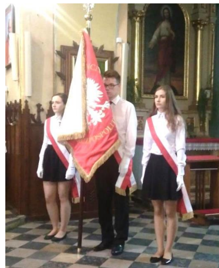
Poczet Sztandarowy ZSO w Grębowie

Pragniemy przypomnieć, że termin składania wniosków na stypendia szkolne o charakterze socjalnym jest do 15 września 2017r. Prosimy o zapoznanie się z nowym regulaminem obowiązującym od 1 września 2017r. Dzięki pomocy socjalnej będzie możliwość zakupu, m.in.: