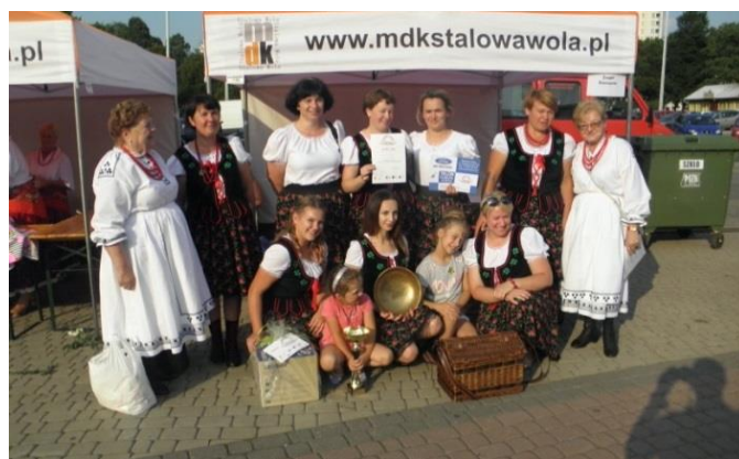
Koniczyna i Grębowianki na Lasowiackim Festiwalu Pierogów

Rywalizacja o „złotą misę”, występy artystyczne, warsztaty i degustacje to tylko niektóre z atrakcji przygotowanych przez organizatorów festiwalu, który odbył się 22 lipca w Stalowej Woli. Pyszne pierogi serwowane przez Koła Gospodyń Wiejskich, lokalne zespoły i restauratorów zachwyciły podniebienie nie jednego smakosza. W festiwalu wzięły udział dwa zespoły działające przy GCK: Grębowianki i Koniczyna ze Stalów-Siedliska. Zmagania odbywały się w dwóch kategoriach: Koła Gospodyń Wiejskich i restauratorzy. W pierwszej kategorii najlepsze pierogi przygotował zespół Koniczyna i tym samym zdobył „złotą misę”