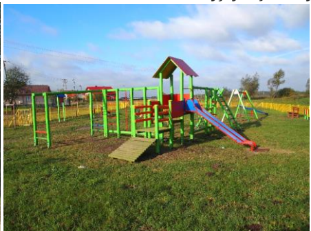
Plac zabaw Grębów-Szlachecka