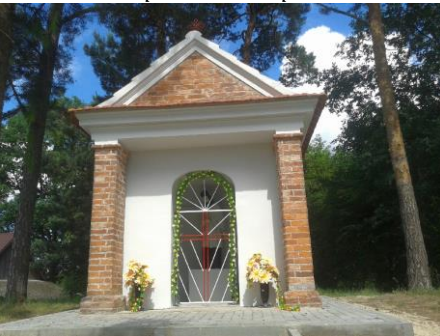
Kapliczka Św. Jana w Grębowie