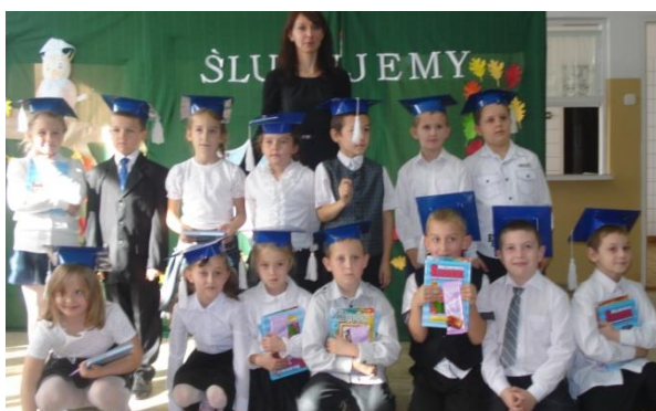
Klasa I - Szkoła Podstawowa w Zespole Szkół w Stalche