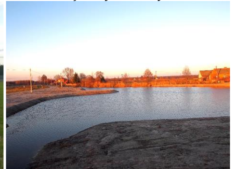
Oczko wodne - zbiornik retencyjny w Jamnicy