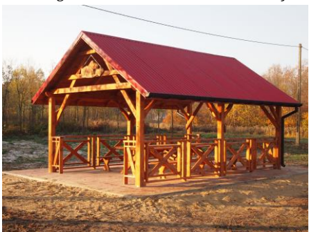
Altana w Żupawie