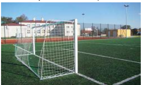
Boisko sportowe „Orlik” w Wydrzy