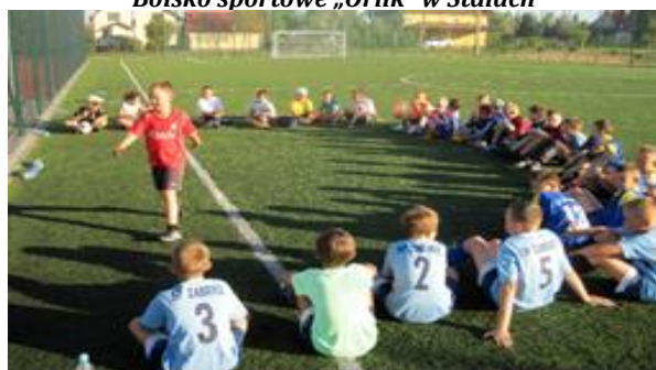
Boisko sportowe „Orlik” w Grębowie