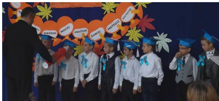
Klasa I - Szkoła Podstawowa w Zespole Szkoła Podstawowa i Przedszkole w Wydrzy