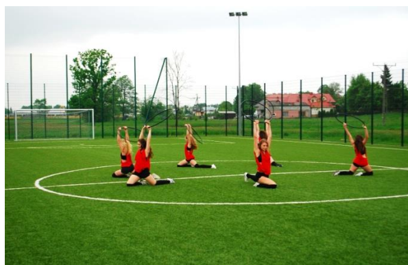
Boisko sportowe „Orlik” w Stalach