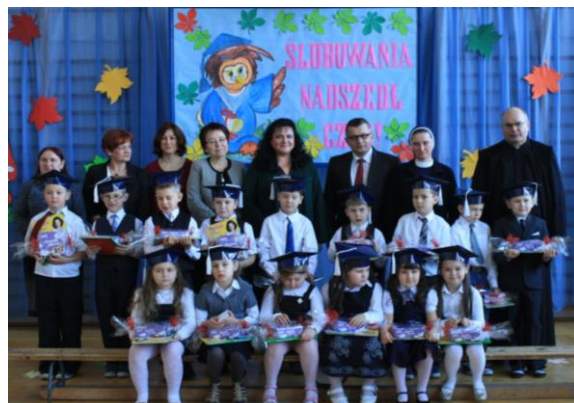
Klasa I a - Filialna Szkoła Podstawowa w Zapoledniku