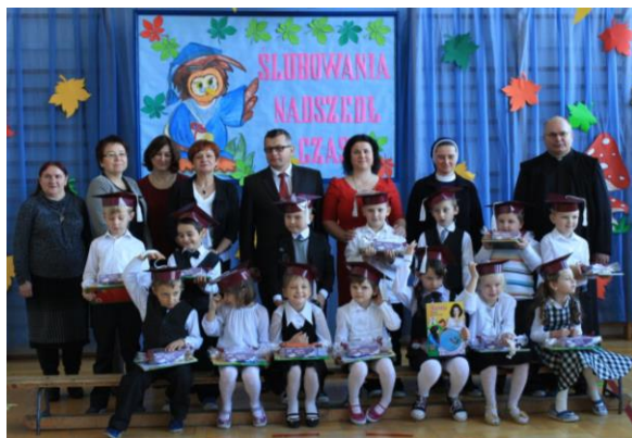
Klasa I b - Filialna Szkoła Podstawowa w Zapoledniku

Poniżej krótka fotorelacja z odbytych uroczystości.