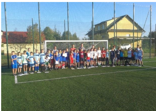
Boisko sportowe „Orlik” w Grębowie