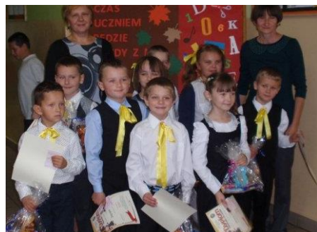
Klasa I - Szkoła Podstawowa w Żupawie