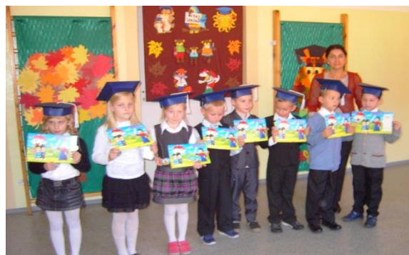
Klasa I - Filialna Szkoła Podstawowa w Jamnicy