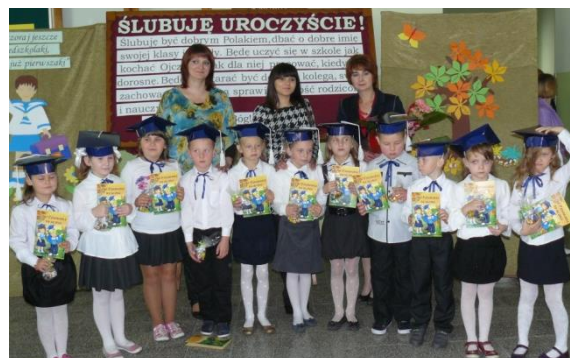
Klasa I - Szkoła Podstawowa w Zabrzu