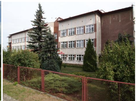
Modernizacja budynku szkoły w Stalach