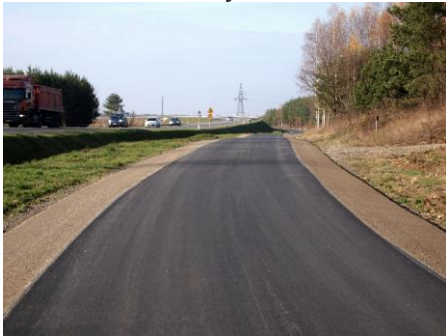
Droga serwisowa wzdłuż obwodowej