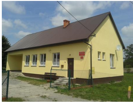
Budynek weterynarii w Grębowie