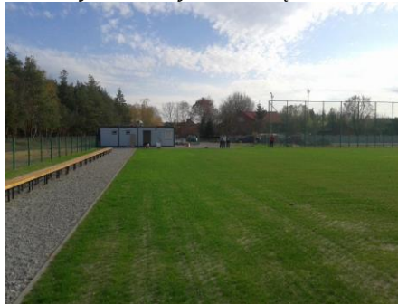
Boisko sportowe w Żupawie