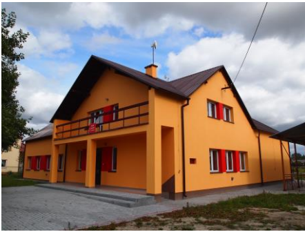
Dom Ludowy w Zabrnium