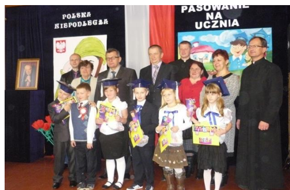
Klasa I - Szkoła Podstawowa w Krawcach