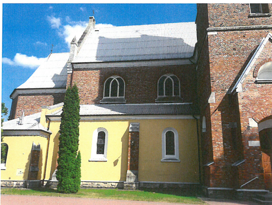
Fot. 1 Istniejący kościół – elewacja.

w wypadku stwierdzenia degradacji aluminiowej blachy w okolicach rur miedzianych zaleca się, po wcześniejszych uzupełnieniach, wykonanie dodatkowych rur które sprowadzałyby wodę z wyższych rur do znajdujących się poniżej, i położenie ich na powierzchni połąci niższych. Zabieg miałby na celu odizolowanie wody z jonami miedzi od powłok aluminiowych. (woda cieknącą po aluminium nie oddziaływuje na miedź).